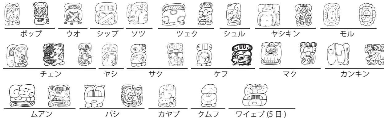
ハアブ暦の月の名前 (複数の形式があります)

ハアブ は 20 日をひと月とする、18 か月と 5 日で構成される 365 日の暦です。