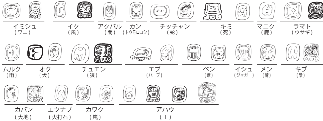
ツオルキン暦の日の名前 (複数の形式があります)

ハアブ は 20 日をひと月とする、18 か月と 5 日で構成される 365 日の暦です。